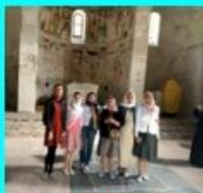
Zwischen zwei Pandemie-Wellen: Pilgerreise aus Liechtenstein zum russischen Gottesdienst in der historischen Kirche St. Peter Mistral-GR (20.09.2020)