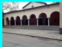
Griechische Gottesdienste finden weiter in St Gallen statt (unter Einhaltung der Schutzmassnahmen) Feldstr.18, 9001 St. Gallen