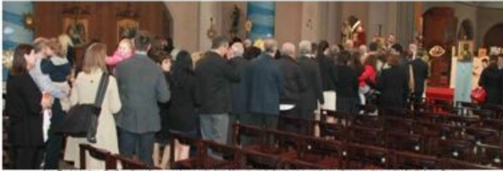
Am Ende jedes Gottesdienstes verehren wir das Kreuz und die Ikonen und empfangen den priesterlichen Segen