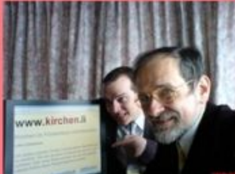
Interkonfessionelle Internetpräsenz 2006