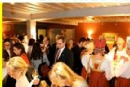
Foto: Serben, Russen, Griechen und Ukrainer feierten zusammen im Rathaussaal Vaduz

Wir beteiligten uns sehr aktiv am kirchlichem und kulturellem Leben zum Teil mit der finanziellen Unterstützung vom Liechtensteinischen Staat.