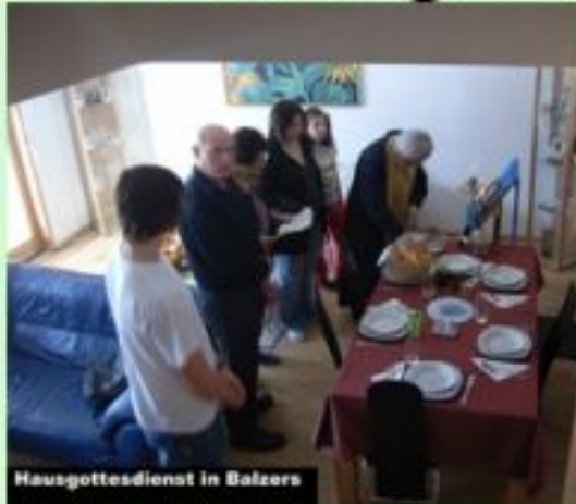
Hausgottesdienst in Balzers

Die seelsorgerische Tätigkeit beinhaltet unzählige Haus- oder Spitalbesuche. Viele orthodoxe Familien halten die Tradition der „Hauskirche“ lebendig, die mindestens einmal jährlich von einem orthodoxen Priester besucht wird. Das rote Ei beim Ostergruss ist ein Symbol der Auferstehung, die allen Hoffnung und Heilung bringt.