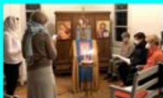
Weltgebetstag 2021 (unter Einhaltung der Schutzmassnahmen)