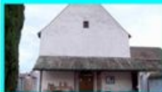
Serbische Gottesdienste finden weiter in Meis statt (unter Einhaltung der Schutzmassnahmen) Klosterweg 9, 8687 Meis