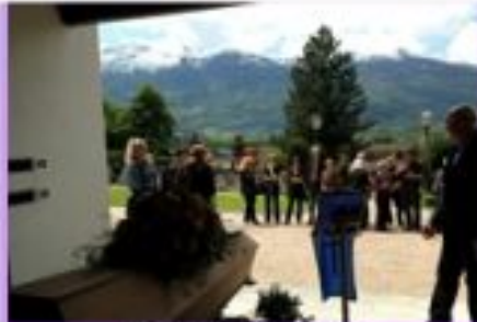
Beerdigung in Vaduz 2013

Unsere lieben Verstorbenen ruhen im Schutze der liechtensteinischen Kommunalfriedhöfe. Die Orthodoxen Christen schätzen sehr die Sympathie der Einheimischen ohne konfessionellen Unterschied, und wollen keine getrennten Friedhöfe.