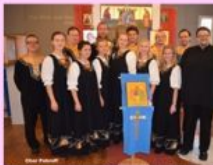
Der russische Chor ist bei allen beliebt