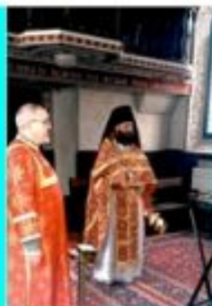
Gedenken für alle orthodoxen Verstorbenen, die im Schutze der liechtensteinischen Friedhöfe ruhen (Melde-T1 13.05.2020)